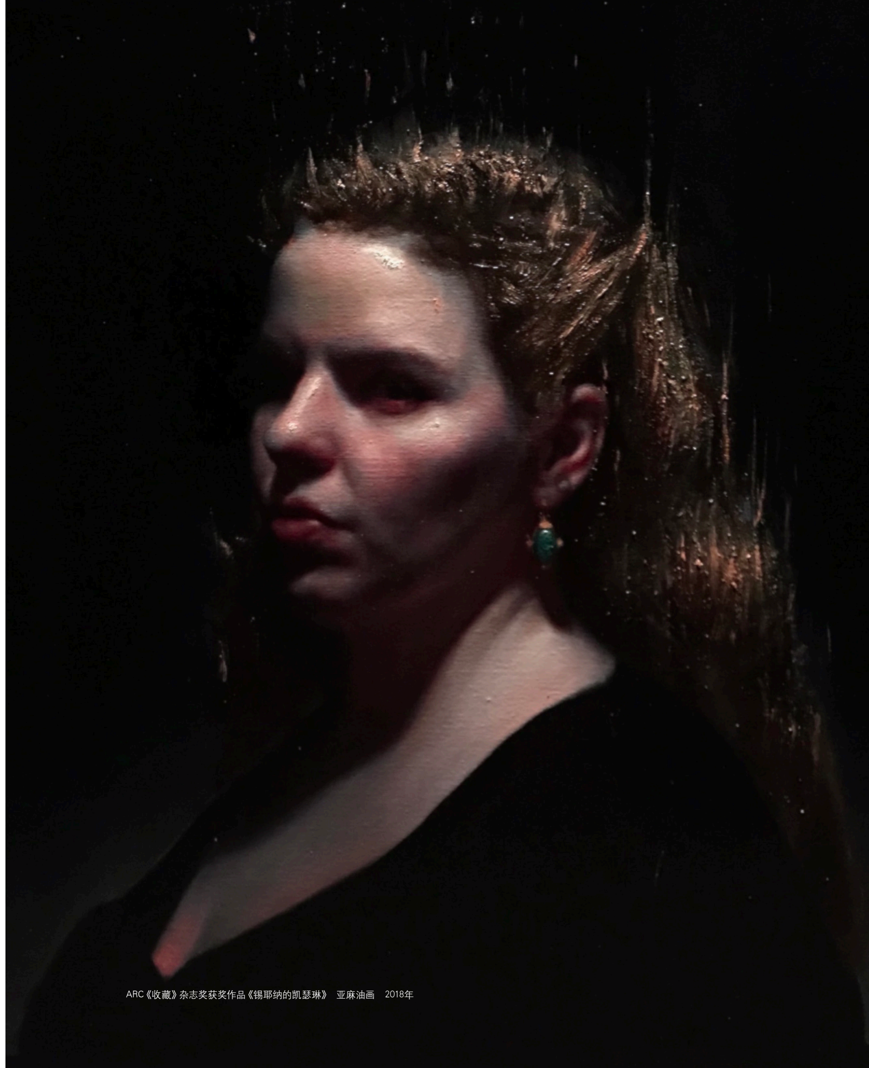
ARC《收藏》杂志奖获奖作品《锡耶纳的凯瑟琳》 亚麻油画 2018年