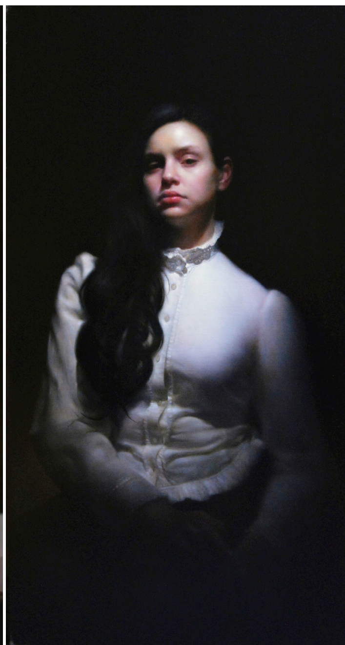
《雷切尔小姐》 亚麻油画 2016年

《收藏》：你给我印象最深的一个画面是：孩子被吊带吊在你怀中，你在画前进行创作。这是现实中真实的状况吗？倘若这是真实的状况，你是怎样做到既要照顾好孩子，又要在不受干扰的情况下进行创作？